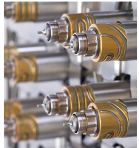
La technologie UltraSync permet l'espacement rapproché des buses.

Contactez Husky aujourd'hui pour en savoir plus sur la technologie de canaux chauds UltraSync.