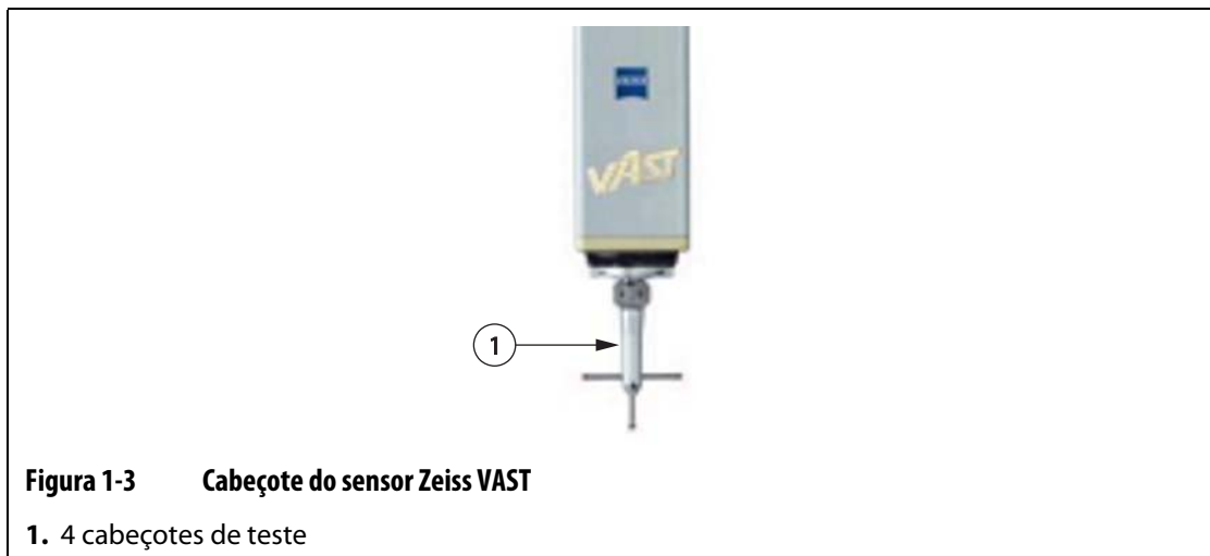
Figura 1-3 Cabeçote do sensor Zeiss VAST